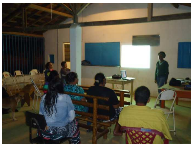
Foto 18: Reunião com comunidade rural de Matos em 10.04.2013