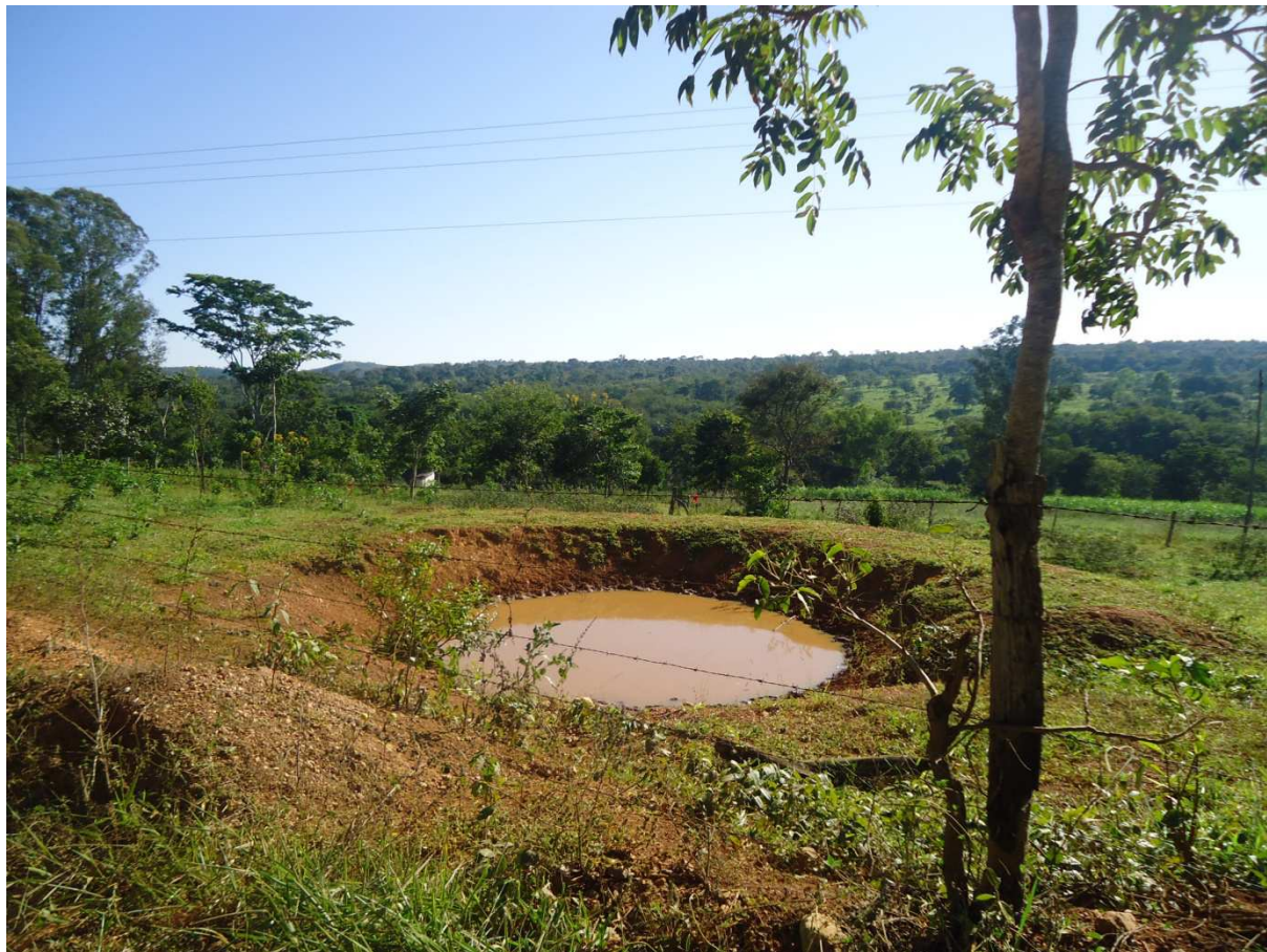
Foto 36: Barragem para captação de água de chuva nas margens da estrada rural na comunidade de Saco da Vida