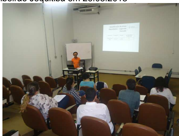
Foto 16: Reunião com o SCBH Ribeirão Jequitibá em 10.07.2013