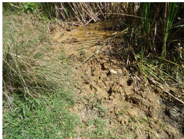
Fotos 25: Nascente na propriedade de Geraldo – pisoteamento de animais