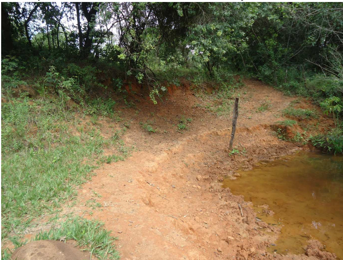
Foto 24: Área de preservação permanente a recuperar na propriedade de Geraldo