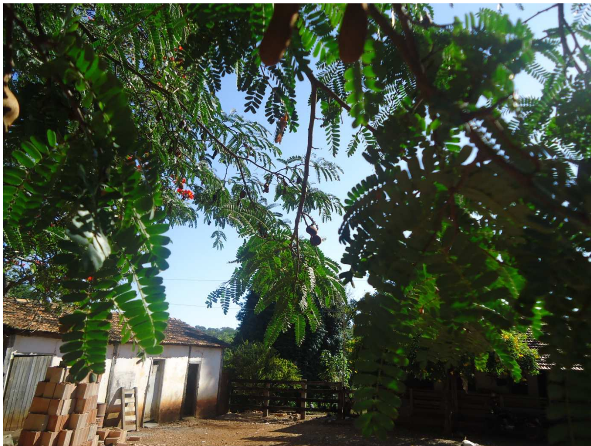
Foto 39: Vegetação típica do cerrado em propriedade da comunidade de Saco da Vida