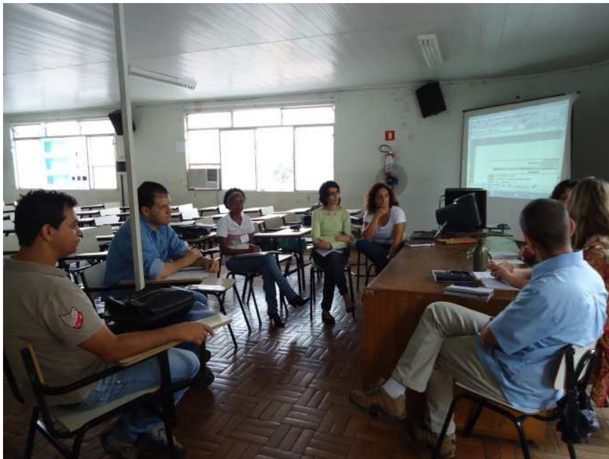
Foto 14: Reunião com o SCBH Ribeirão Jequitibá em 26.03.2013