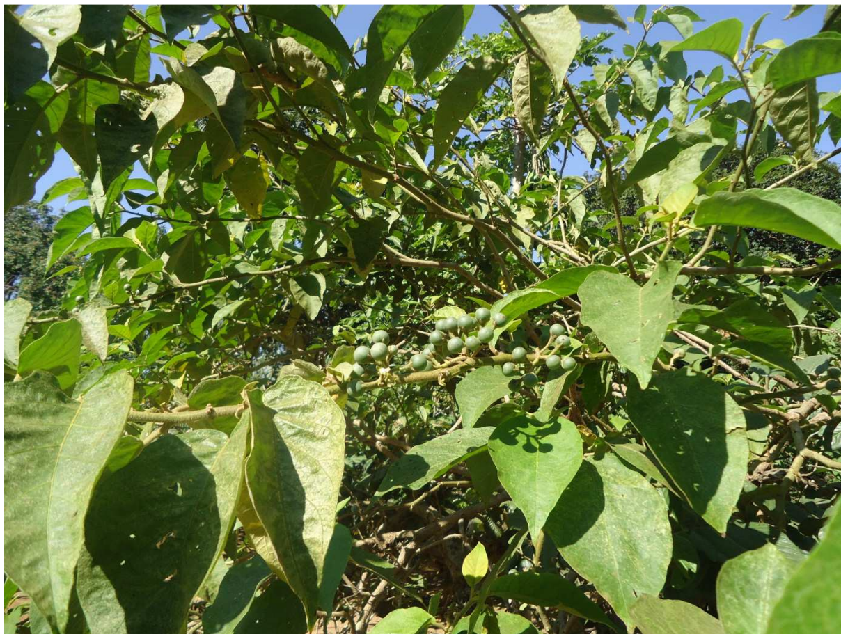
Foto 44: Vegetação típica de cerrado na sub bacia do Córrego Forquilha