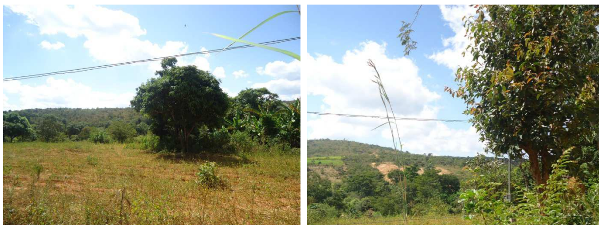
Fotos 35: Vegetação típica do cerrado na sub bacia do Córrego Cambaúbas