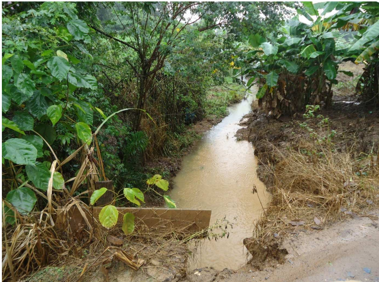
Foto 6: Ribeirão Jequitibá na comunidade rural de Matos Coordenadas: UTM 23 K longitude: 584101.00 m E e Latitude:7840647.00 m S