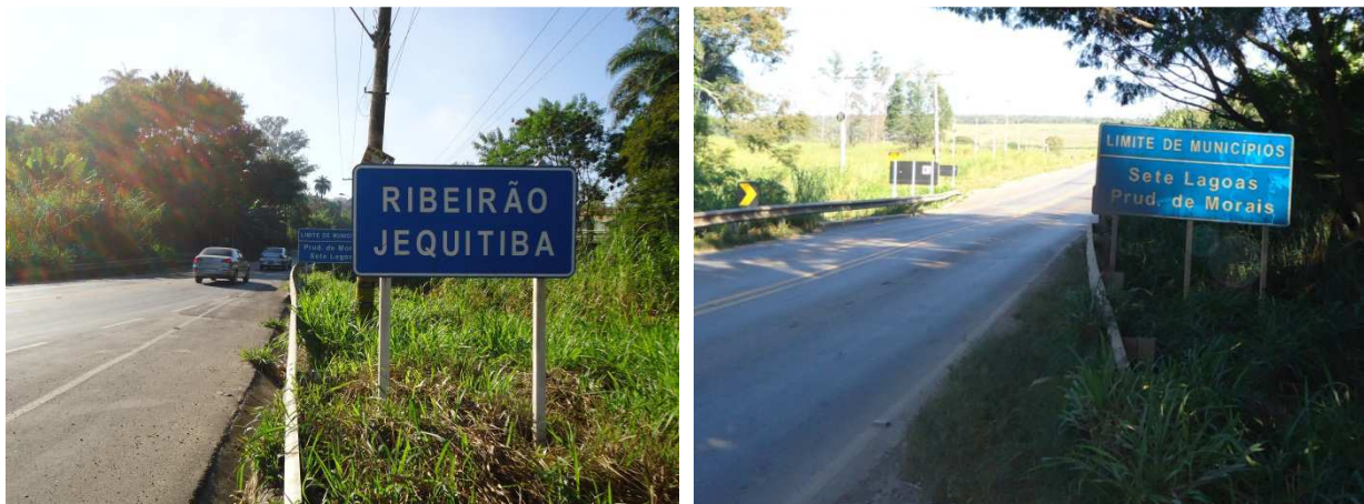
Fotos 5: Placas indicativas do Ribeirão Jequitibá na MG 424 – divisa dos municípios de Sete Lagoas e Prudente de Morais