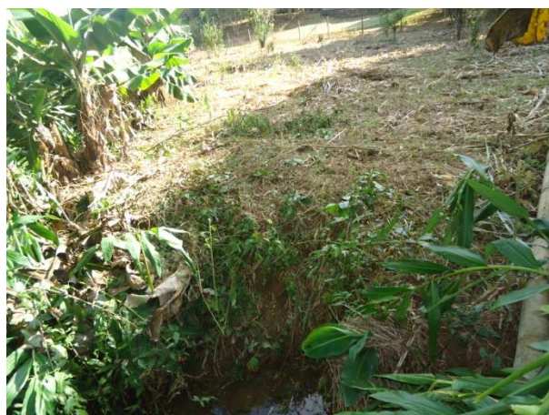
Foto 32: Ausência de mata ciliar nas margens do curso d'água que passa pela propriedade Rogério