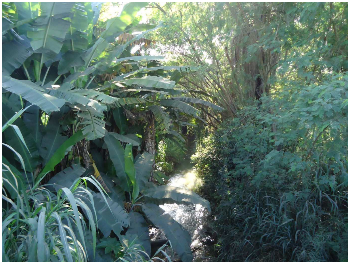
Foto 1: Ribeirão Jequitibá na MG 424 – vista de montante para jusante Coordenadas: UTM 23 K longitude: 586882.55 m E e Latitude:7847148.37 m S