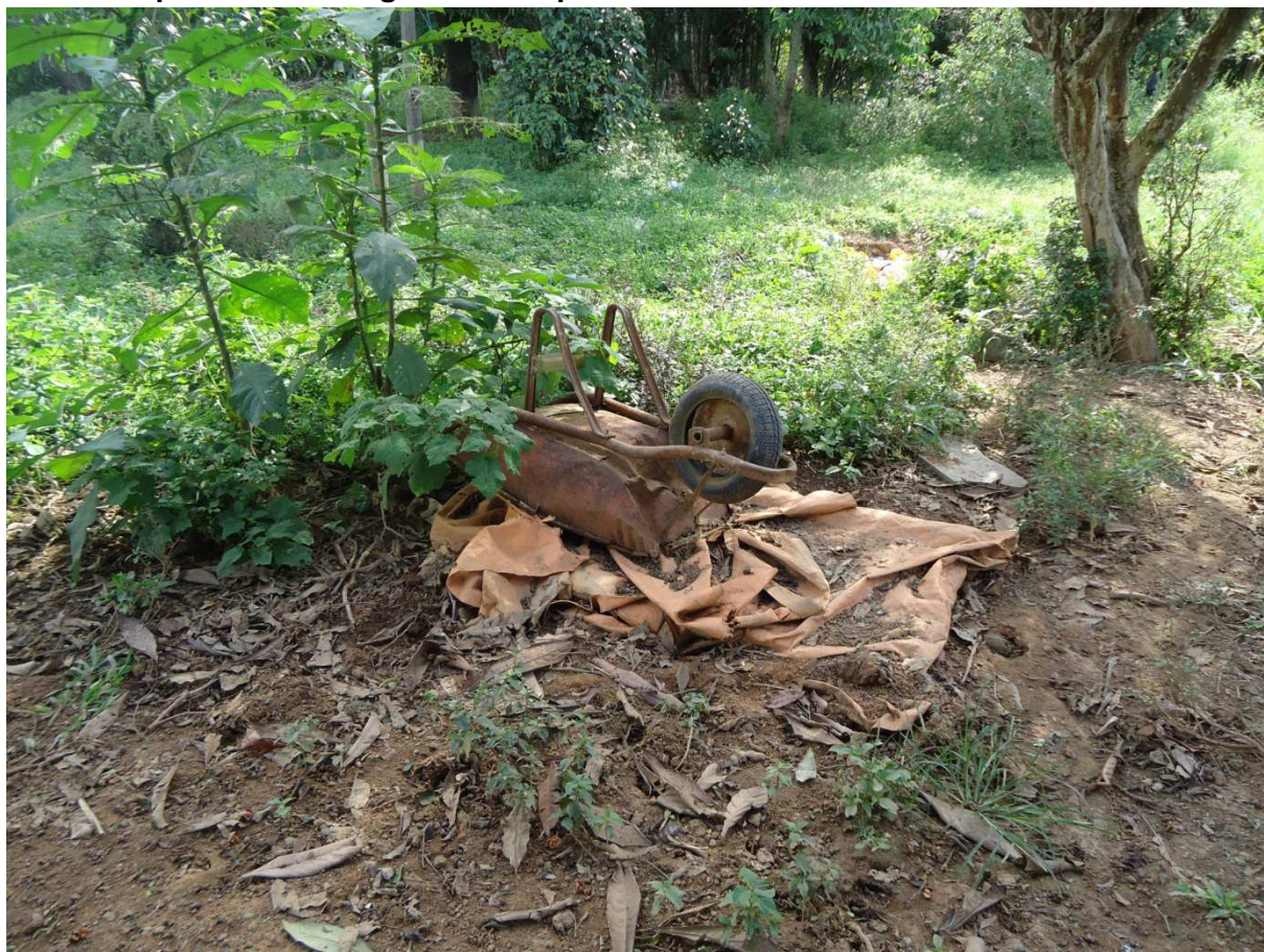
Foto 27: Fossa negra em uso coberta por lona e um carrinho de mão inutilizado na propriedade de Rogério