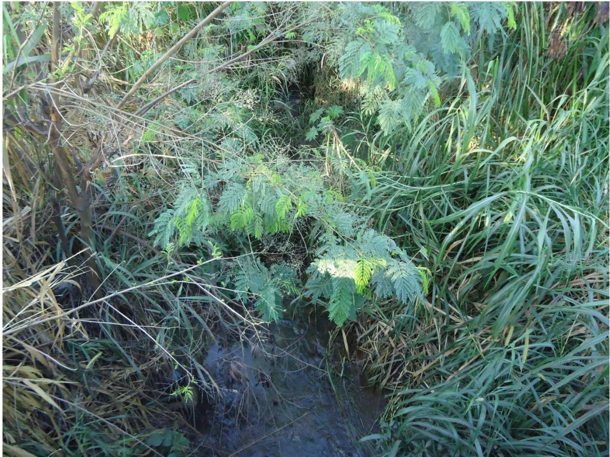
Foto 4: Ribeirão Jequitibá na MG 424 – vista de jusante para montante