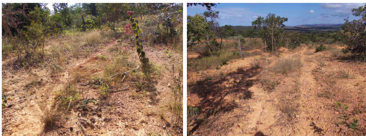
Fotos 41: Área degradada a recuperar na propriedade de João Tuyama