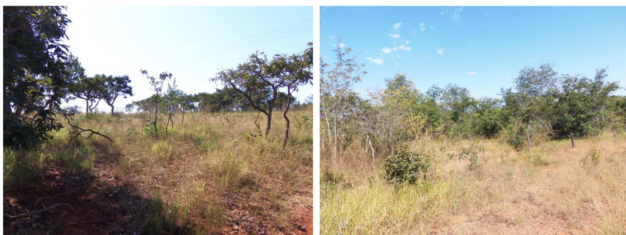
Fotos 49: Vegetação típica do cerrado na bacia do Ribeirão Jequitibá